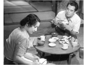
1951 LE REPAS (Meshi) de Mikio Naruse avec Ken Uehara