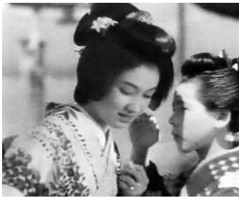
1935 N'HÉSITEZ PAS LES JEUNES GENS (Tamerau nakare wakodo yo) de Tetsu Taguchi