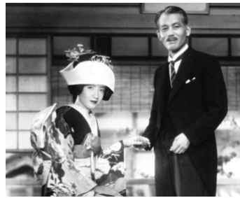
1949 PRINTEMPS TARDIF (Banshun) de Yasujiro Ozu avec Chishu Ryu