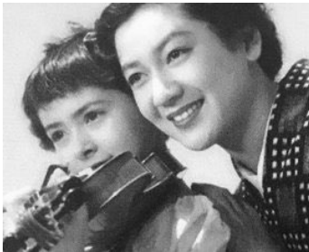
1954 PROMENADES DANS LES NUAGES (Non chan kumo ni noru) de F. Kurata avec H. Wanibuchi