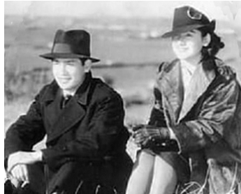
1938 BEAU DÉPART (Uruwashiki Shuppatsu) de Satsuo Yamamoto avec Ichiro Tsukida