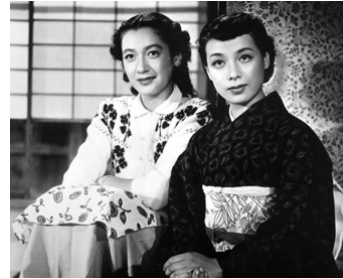
1951 ÉTÉ PRÉCOCE (Bakushū) de Yasujiro Ozu avec Kuniko Miyake