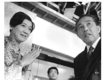
1961 AFFECTION HUMAINE (Bojō no hito) de Seiji Maruyama avec Yumi Shirakawa