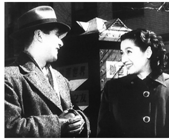
1949 MADEMOISELLE À VOTRE SANTÉ (Ojōsan kanpai) de Keisuke Kinoshita avec Shūji Sano