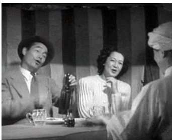
1947 LA GRANDE ÉPOQUE (Kake-dashi jidai) de Kiyoshi Saeki avec Susumu Fujita