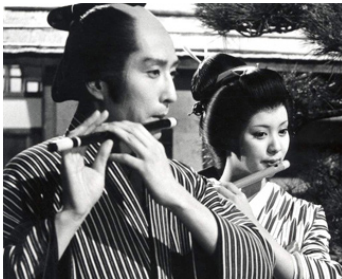
1939 LA PRINCESSE SERPENT (Hebihimesama) de Teinosuke Kinugasa avec Seishirô Hara