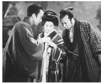
1936 LE PRÊTRE DES TÉNÉBRES (Kochiyama sôshun) de S. Yamanaka avec Ch. Kawarasaki