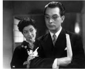
1951 LA MARCHÉ NUPTIALE (Kekkon koshinkyoku) de Kon Ichikawa avec Ken Uehara