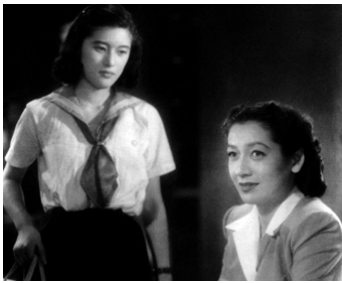
1949 LA MONTAGNE BLEUE (Aoi sanmyaku) de Tadashi Imai avec Yoko Sugi