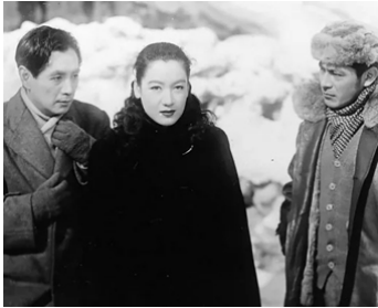
1951 L'IDIOT (Hakuchi) d' Akira Kurosawa avec Masayuki Mori, Toshiro Mifune