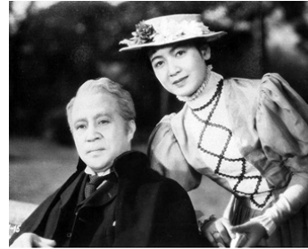
1937 LA LÉGENDE DU GÉANT (Kyojin-den) de Mansaku Itami avec Denjiro Okochi