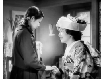
1939 JOUR DE NOCES (Totsugu hi made) de Yasujiro Shimazu avec Yoko Yaguchi