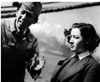
1943 AIR CHAUD (Neppu) de Satsuo Yamamoto avec Susumu Fujita