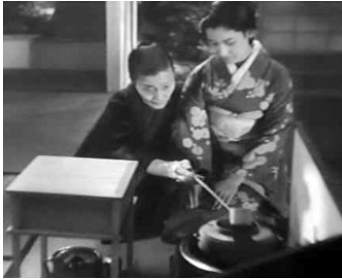
1936 LE SACRE DE LA VIE (Seimei no kanmuri) de Tomu Uchida avec Jogi Oka