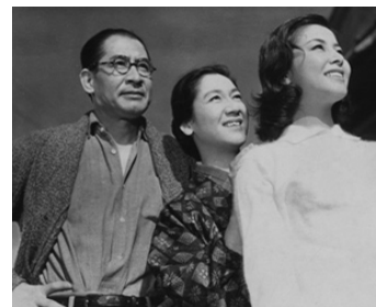
1961 MA FILLE ET MOI (musume to watashi) de H. Horikawa avec So Yamamura, Yuriko Hoshi