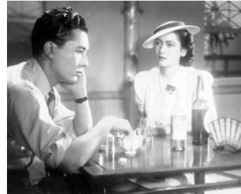
1939 ROMANCE À TOKYO (Tokyo no josei) d'Osamu Fushimizu avec Akira Tatematsu