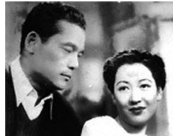
1942 TERRE VERTE (Midori no daichi) de Yasujiro Shimazu avec Susumu Fujita