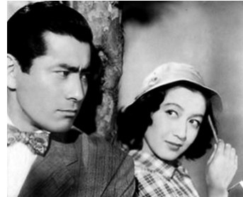
1952 LES AMOUREUX DE TOKYO (Tokyo no koibito) de Yasuki Chiba avec Toshiro Mifune