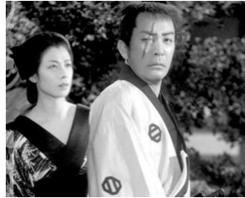
1936 LA LUMIÈRE DU SOLEIL (Tange Sazen, nikko no maki) de K. Watanabe avec D. Okochi