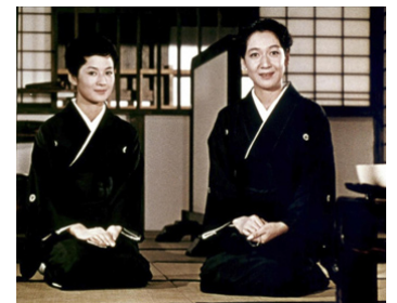
1960 FIN D'AUTOMNE (Akibiyori) de Yasujiro Ozu avec Yoko Tsukasa