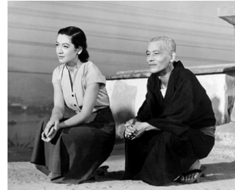
1953 VOYAGE À TOKYO (Tokyo monogatari) de Yasujiro Ozu avec Chishu Ryu