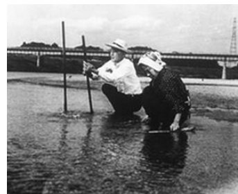
1961 DERNIER CAPRICE (Kohayagawa-ke no aki) de Yasujiro Ozu avec Ganjiro Nakamura