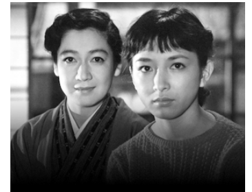
1957 CRÉPUSCULE À TOKYO (Tokyo boshoku) de Yasujiro Ozu avec Ineko Arima