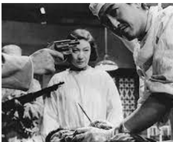
1957 LA DERNIÈRE ÉVASION (Saigo no dasso) de Senkichi Taniguchi avec Hiroshi Tachikawa