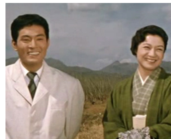
1959 FILLE, ÉPOUSE ET MÈRE (Musume tsuma haha) de Mikio Naruse avec Akira Takarada