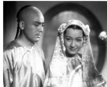
1942 LA GUERRE DE L'OPIUM (Ahen Senso) de Masahiro Makino avec Seizaburo Kawazu