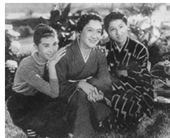
1957 ÊTRE UNE FEMME (Onna de Aru koto) de Yūzō Kawashima avec Yoshiko Kuga