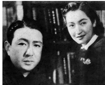
1941 LE MARIAGE DE LA NATURE (Kekkon no seitai) de Tadashi Imai avec Daijiro Natsukawa