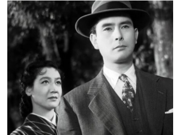
1954 LE GRONDEMENT DE LA MONTAGNE (Yama no oto) de M. Naruse avec Ken Uehara