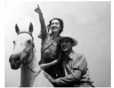
1950 HISTOIRE SAUVAGE (Arupusu monogatari yasei) de Tsutomu Sawamura avec Hajime Izu