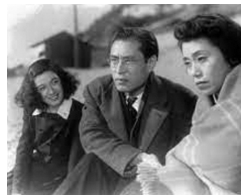
1947 TENTATION (Yuwaku) de Kozaburo Yoshimura avec Shin Saburi, Haruko Sugimura