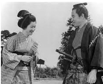
1961 LA VIE D'UN MÉDECIN DE CAMPAGNE (Fundoshi isha) de H. Inagaki avec Sō Yamamura