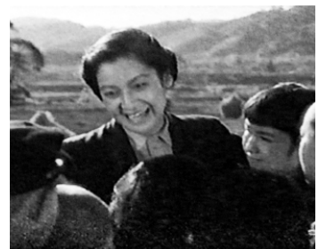
1946 LA MAISON VERTE (Midori no furusato) de Kunio Watanabe