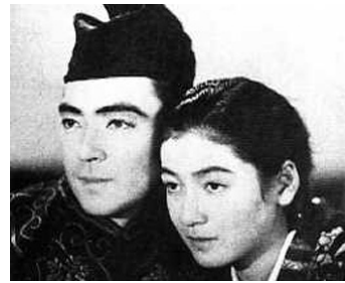
1936 LE PROCUREUR ET SA SŒUR (Kenji to sono imôto) de Kunio Watanabe avec Jogi Oka