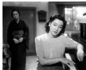
1946 JE NE REGRETTE RIEN DE MA JEUNESSE (Waga seishun ni kuinashi) d'Akira Kurosawa