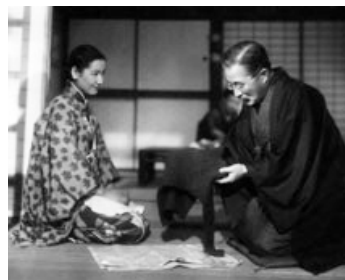
1944 LA COLÈRE DE LA MER (Ikari no umi) de Tadashi Imai avec Denjiro Okochi