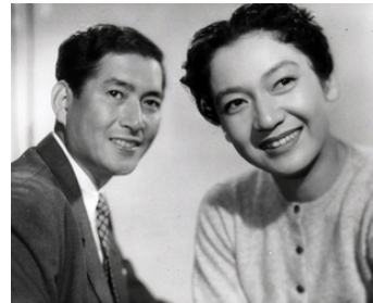
1956 PLUIE SOUDAINE (Shu-u) de Mikio Naruse avec Shuji Sano